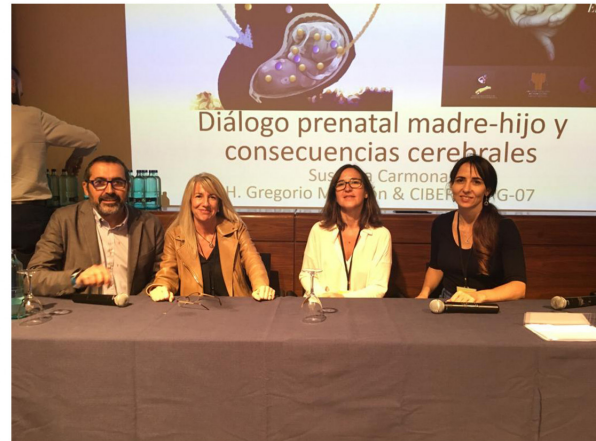
1ª Mesa de la Jornada