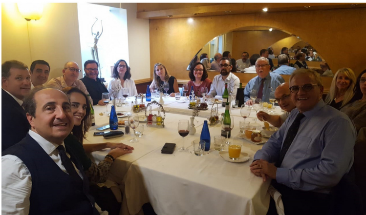
Comida de Clausura de la Jornada